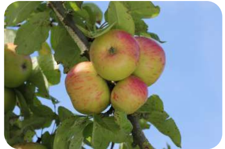
Jacques Lebel, een appel met sapopbrengst tot wel 80%

Wanneer je een specifiek doel voor ogen hebt om je fruit te verwerken, zoals sap of keukengebruik, kiezen we voor variëteiten die gekend staan om hun goede eigenschappen voor dit gebruik. Om een regelmatige productie te bekomen, moeten we rekening houden met voldoende, maar ook niet te veel goede kruisbestuivers tussen deze variëteiten in.