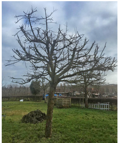
Te veel snoeien leidt het volgende groeiseizoen tot veel ongewenste, snelgroeïende twijgen (waterloten).

Een ervaren snoeier zal enkel snoeien wat nodig is en houdt rekening met verschillende factoren, gaande van het behandelen van dominante, afhangende en dode takken, wildopslag, de juiste snede en diens positie... en het eventueel uitbuigen van verticale takken. Ook zal hij jonge en volwassen bomen anders behandelen en maakt hij bij zijn snoei onderscheid tussen pitfruit, steenfruit en noten.