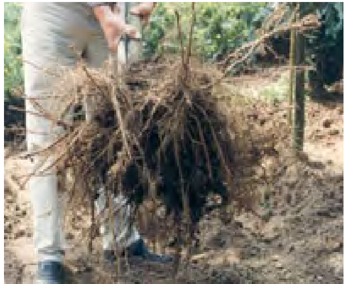
Boom met naakte wortel.

De aanklevende modderbrij zorgt ervoor dat de grond van het plantgat goed aansluit met de wortels, zodat nieuw gevormde haarworteltjes in vruchtbare aarde terecht komen waar ze kunnen groeien in plaats van in een ingesloten luchtbel waar ze zullen verdrogen en afsterven.