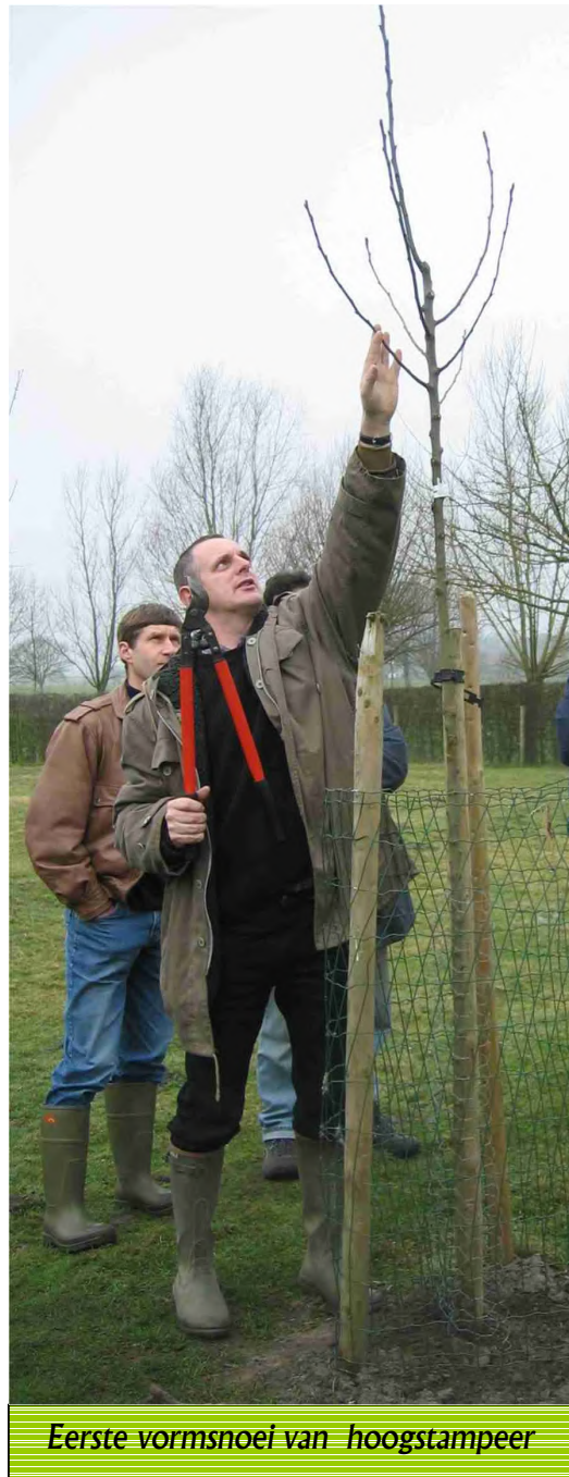
Eerste vormsnoei van hoogstampeer

Concreet: bij een groei van 70 cm of meer maximaal 1/3 de van de eenjarige twijgen wegnemen en bij een groei van 40 cm of minder tot 2/3 de wegnemen.